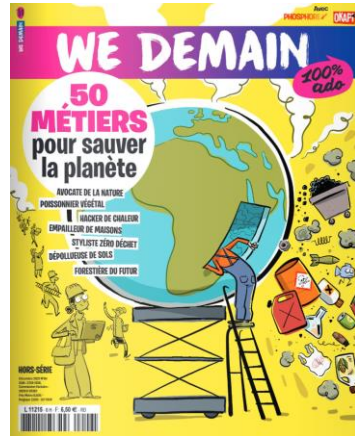
N°6 : 50 métiers pour sauver la planète