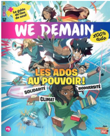
N°5 : les ados au pouvoir + le guide du rien du neuf